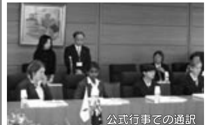
公式行事での通訳