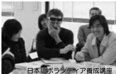
日本語ボランティア養成講座