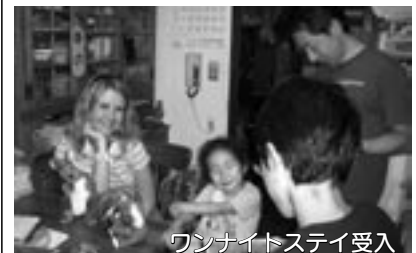
ワンナイトステイ受入