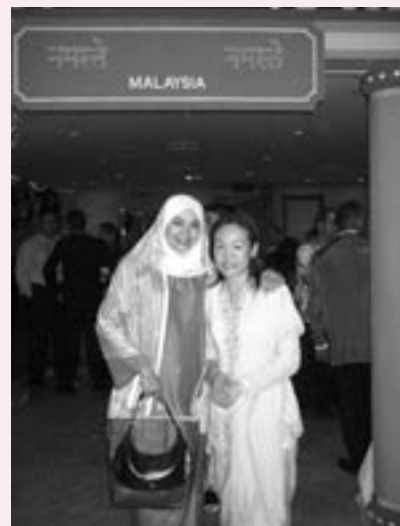
会社の交流イベントで友人とパチリ(マレーシア・クアラルンプールにて)

去年一年間は日本語学校に通い、今年からホテルの専門学校で勉強しています。日本で就職できたら幸いですが、帰国しても日本語をいかせる仕事がしたいと思います。