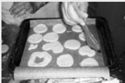
*形はさまざま。美味しくできました。

出会いと別れの季節の4月、帰国して3年、「東京に出張になったので。」と、ひょっこり香港のジャックが顔をみせてくれました。彼はサロンの卒業生。「こんな嬉しいことがあるから、やめられないのよ。」とボランティアスタッフは皆大喜び。「僕の帰った後もサロンはやっているんですか！」と楽しい再会になりました。