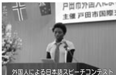
外国人による日本語スピーチコンテスト