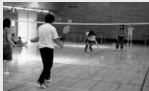
*さわやかな汗を流して、仲良くなりました。

全員参加の桜もち作り(3月24日)やクッキー作り(4月14日)では、出来の良し悪しに関係なく皆で楽しめるプログラムでしたが、一方で、思い切り体を動かしたいという要望もあって、4月28日のサロンは体育館でバドミントンや卓球で遊ぶことに。外国人の方が留学や仕事の関係で限られた滞在期間で日本人と仲間になるには、是非サロンにお出かけください。サロンでの日本語のやりとりは、言葉の訓練になります。また、国の言葉で思い切りしゃべりたい時は、きっと同じ国の人も来ています。(市民交流委員会)