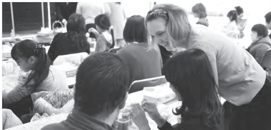
親切丁寧な指導を受け仕上がりにも大満足