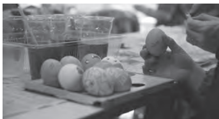
色とりどりに塗られた卵たち

に大人も子どもも興味津々。親子でわいわい楽しく、「次は何色にしよう?」「どんな模様にしようかな?」と染めたり、絵を描いたり、シールでデコレーションをしていくと、真っ白なゆで卵がみるみるうちにカ