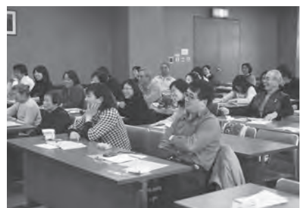
満員の会場は笑いと感動に包まれました