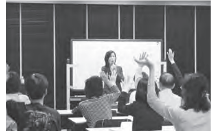
積極的な姿勢に先生もビックリ