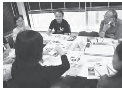
テーマ作りにも工夫をこらして

この日は、日本語ボランティア希望者の見学会も併せて行われ、5名の参加者が、各グループの学習風景