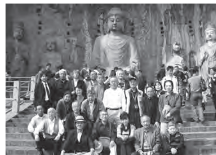
世界遺産「龍門石窟」の前で