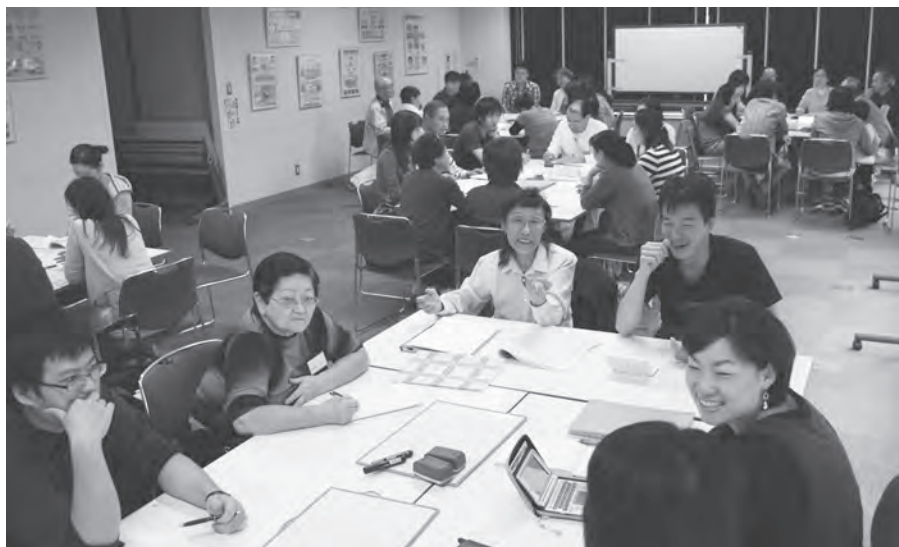
なごやかな雰囲気漂う教室風景