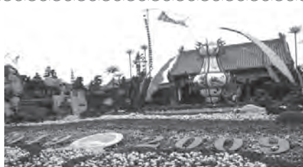
色とりどりの菊がお出迎え

開封市初日は、開封市人民政府への表敬訪問やドイツ、韓国など8カ国の代表団とのレセプションを通して、友好の確認を図りました。