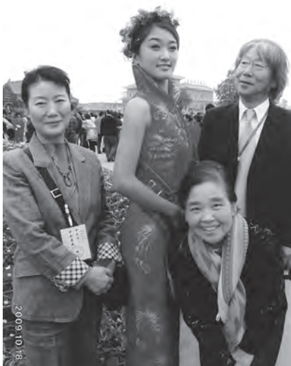
'09 ミス菊祭りを囲んで