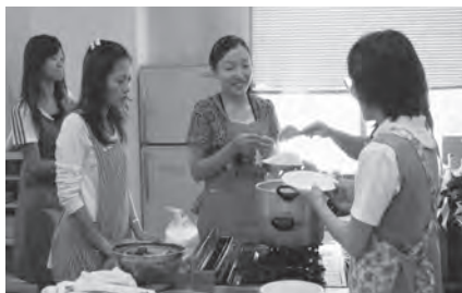
栗ごはんおいしく炊けたかな？

秋といえばやっぱり栗ですね。秋になると日本では栗ご飯を作って食べるそうです。韓国もおなじです。