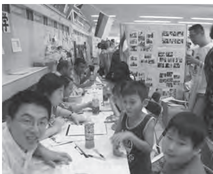
僕たちも覚えてよ、你好！

が、講師として母国の言語・文化・風習、それにお国自慢を熱心に来場者に教えてくれました。