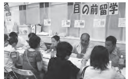
ウルドゥ語に挑戦しました

また、展示ポスターを興味津々に見ている人も多く、国際交流を身近に感じられました。