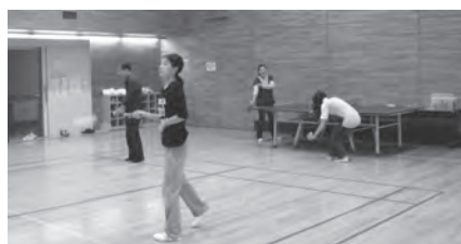
いい汗かきました。